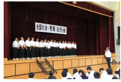
【校長の激励の言葉】