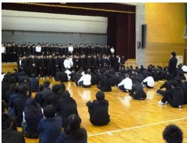
【全国大会出場クラブ】

また、野球部には「『チーム紀北』として正々堂々と戦っている姿を見せてください。そして全員で5回校歌を歌いましょう。」と励ましました。全ての選手の皆さん、精一杯頑張ってください。