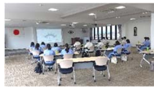
【新中村化学工業(株)】