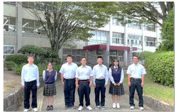
【インターハイ出場者 玄関前】