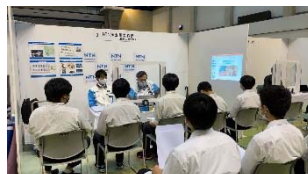
【真剣に企業説明を聞く】