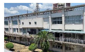
【ホームルーム棟から見た本館】