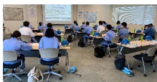
【新中村化学工業（株）】