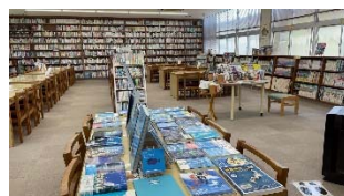
【専門書・雑誌・小説】