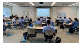
【新中村化学工業（株）】