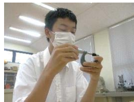
【マイクロメーター】