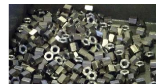
【ゆるまない特殊ナット】