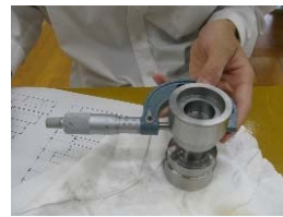
【実測で技術を磨く】