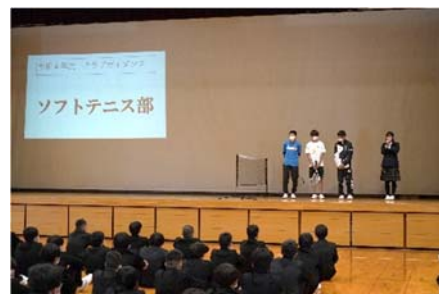
【ソフトテニス部の紹介】

新入生対象に16部活動の紹介がありました。文化系は、ものづくり研究部・吹奏楽部・芸術部・コンピュータ部の4部。運動系は、山岳部・サッカー部・ウエイトリフティング部・陸上部・バスケットボール部・自転車部・バレーボール部・卓球部・剣道部・ソフトテニス部・野球部・レスリング部の12部。中学校には無い部活動もたくさんあり、多くの部活動の中から選ぶ事ができます。後日、部活動の登録をしました。また、部活動を通して学校の活性化へもつながっています。