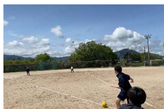
【ハンドボール投げ】

【全国平均3年男子】握力41kg・反復横跳び57点・50m走7.2秒・ハンドボール投げ27m・立ち幅跳229cm 【全国平均3年女子】握力27kg・反復横跳び48点・50m走9.1秒・ハンドボール投げ15m・立ち幅跳172cm