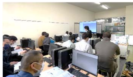
【講師から熱心に学ぶ】

最新の实習機器、コンピュータ制御による金属部品の加工機「マシニングセンター」が導入され、4月から機械科の実習で活用され、生徒達は、最新の技術を学び、日本のものづくりの基本となる技術を習得し、実践的な技術者の育成に貢献します。そのため教員は、機器を活用するための最新の技術の習得と向上を目指し、絶えず自己研鑽を行っています。