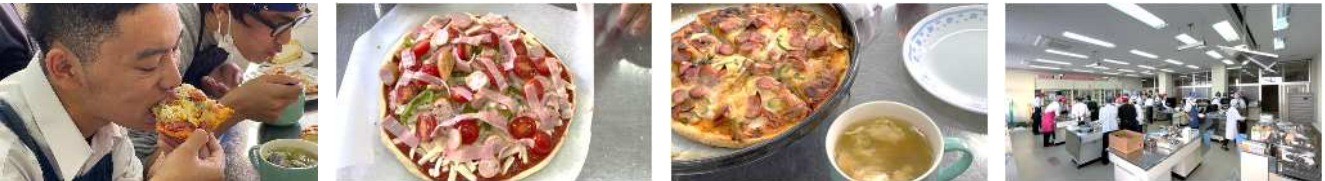
【11.25 機械科 A組_家庭は、必修科目になっています。午前中の調理実習だったので、「お弁当食べられるのか心配」と言っていました。実習模様動画は、インスタにup】