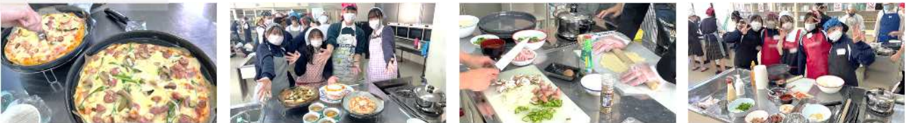
【11.15 システム化学科_具のトッピングは班ごとに準備。専門ピザ屋さんを超える出来栄え、スープも具沢山、3年ぶりの本格実習】