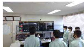
【電気科2年オープンカンパニー（工場見学）、関西電力送配電（株）橋本配電営業所（説明・体験）⇒紀北変電所（施設見学）、高所作業車体験、送電線ケーブル切断、電力集中コントロール室 11.18】