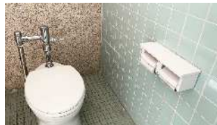
【和式トイレから様式トイレに一部入れ替え】