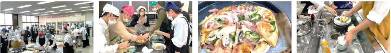
【11.18 機械科 B組_生地を発酵から作りました。生地の膨らみがすごすぎてふわふわ食感。日頃の成果を発揮し、手際良く後片付け】