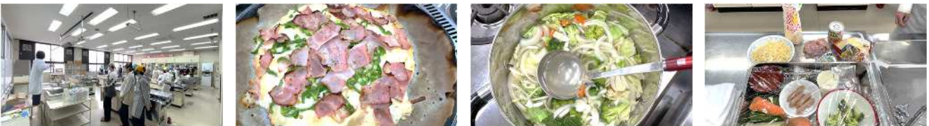
【11.22 電気科_スープは、コンソメ味、ブロッコリー、ニンジン、玉ねぎ、キャベツ。「クッキングシート」は、余分なところは、カットしてオープンへ「なるほど」!!】