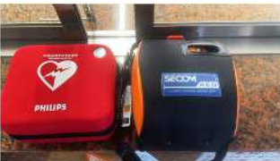
【旧から新へ入れ替え AED 玄関前・体育館前に設置】