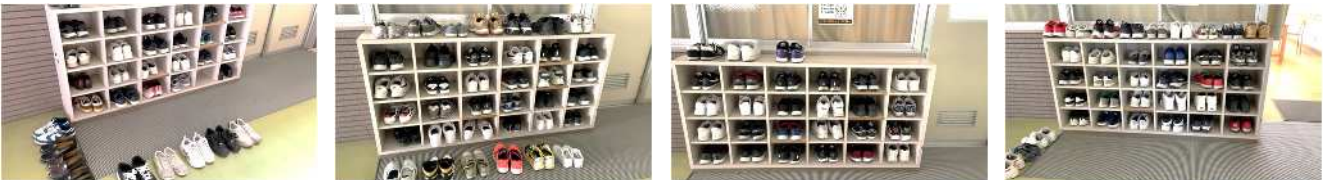
【調理実習を行う上で大切なことは、計画→準備→段取り→班での協力。「靴の並び方」整理整頓がgood!!。靴を揃える→心が整う→気持ちよくスタート→行動が変わる→人生が変わる】