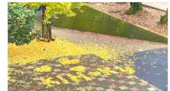
【中庭での落ち葉アート ♥KIHO・素敵】