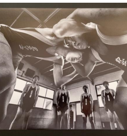
【特選スクールフォートの部「がっぶり四つ」新開写真展】