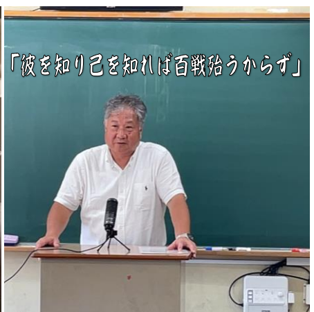
【2学期始業式 式辞 オンライン実施8/28】