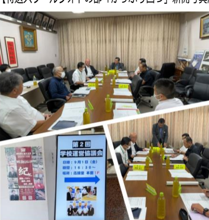
【第2回学校運営協議会9/1】