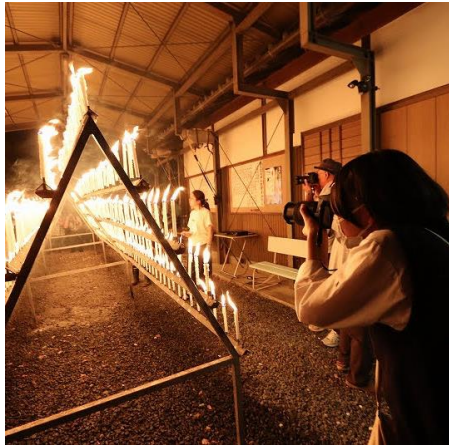
【写真部 光三宝荒神社の献灯祭（ろうそく祭り）】