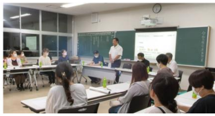
【PTA 役員合同委員会 文化祭参加について9/14】