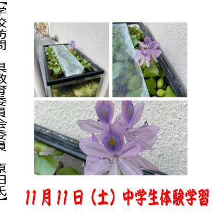
11月11日(土)中学生体験学習