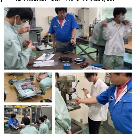
【企業連携 小川工業(株)×ものづくり研究部】