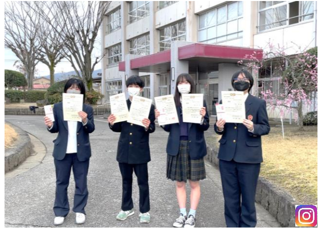
県工業部会第49回照明コンクール金賞・銀賞・銅賞の受賞おめでとう システム化学科2年生