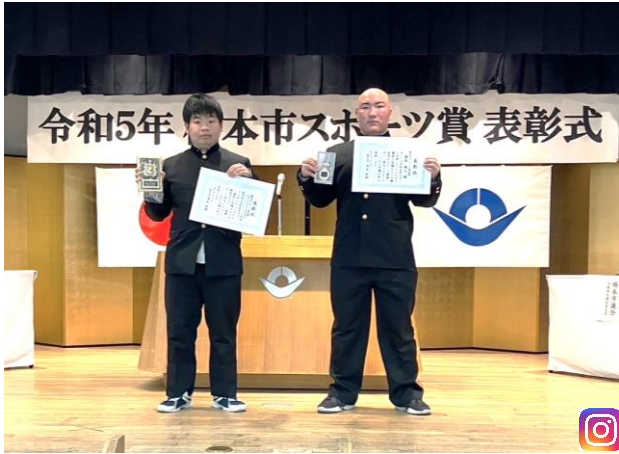
橋本市スポーツ賞（個人・団体）受賞おめでとう ウェイトリフティング部 2/17